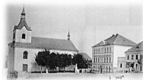
Kostel v Novém Kníně kolem roku 1900