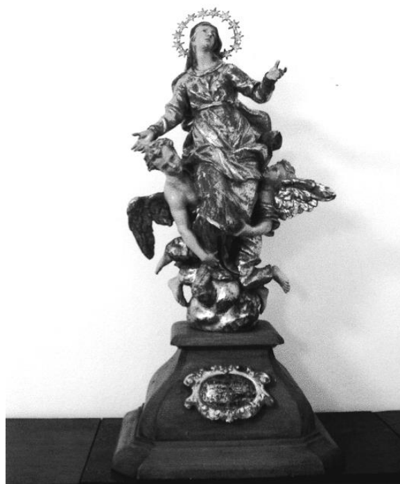
Se sochou, pocházející z pražského kostela sv. Františka, chodila v 17. století procesí ze Starého Knína do Borotic, neboť Borotice byly v té době významným poutním místem.

Proto jí budeme věnovat i v naší farnosti chvíli času a před bohoslužbami ji pozdravíme v loretánských litaních.