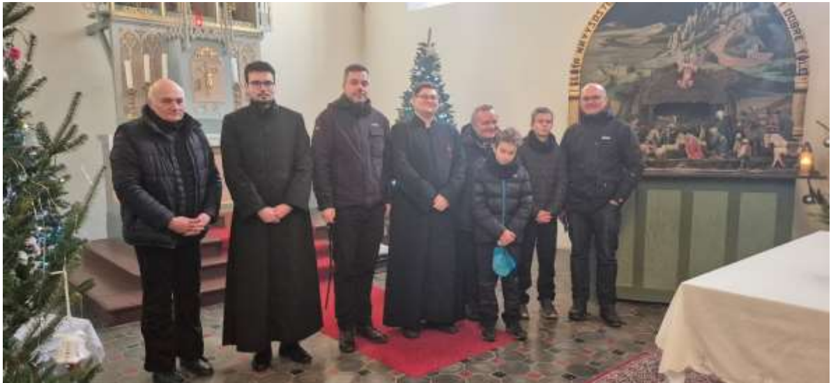
25.1.2025 Pout' staroknínské farnosti na Svatou Horu v jubilejním roce